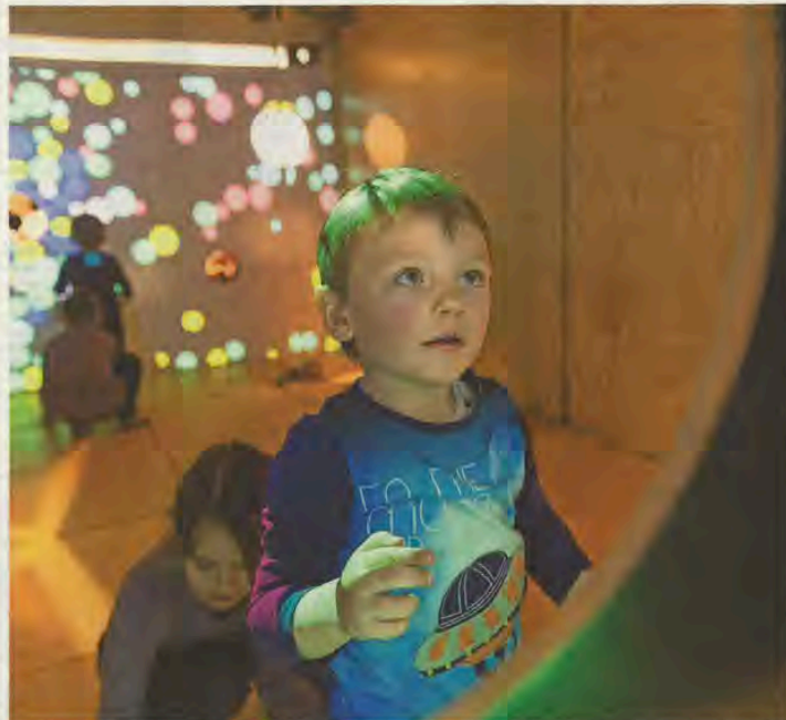
Kinder an der Ausstellung «Die Entdeckung der Welt» am vorherigen Standort in Bellinzona.