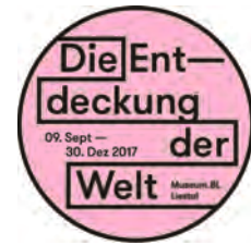
Image-Film Swisslosfonds, Januar 2018

Wir bringen Qualität für die ersten Lebensjahre ins Gespräch.