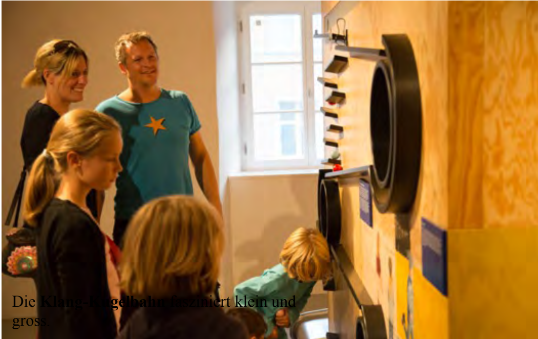
Die Klang-Kugelbahn fasziniert klein und gross.