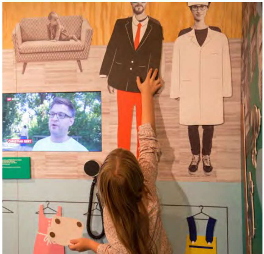
Rückmeldungen von BesucherInnen zeigen, dass die Aktivitäten für Kinder in der Ausstellung sehr geschätzt werden.